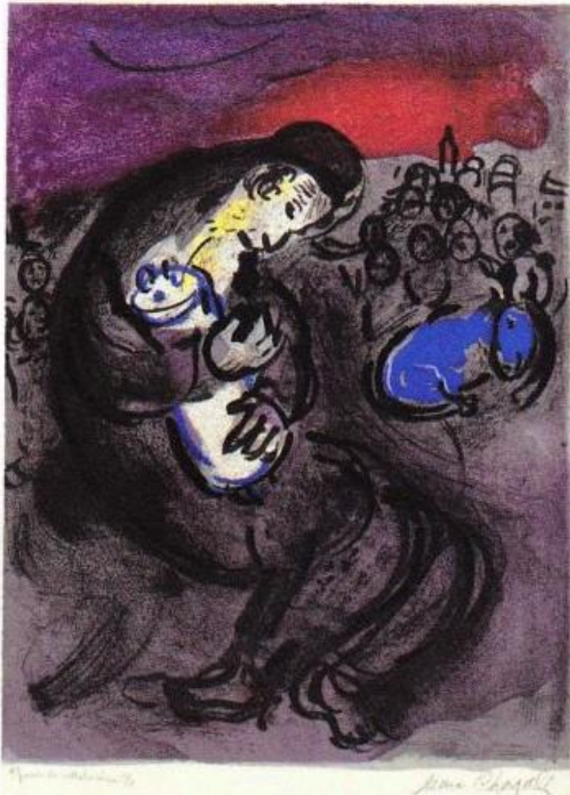
'Les Prophètes', Marc Chagall, 1956