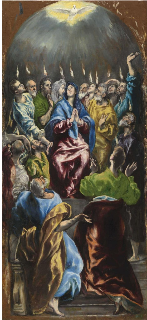
Pentecostés, El Greco, ca. 1600