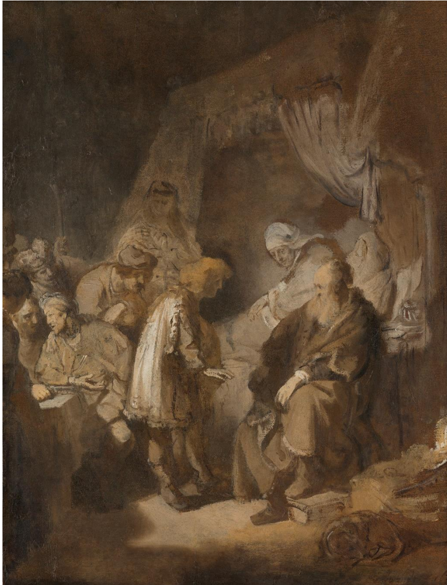
Jozef vertelt zijn dromen, Rembrandt, 1633 In Rijksmuseum, Amsterdam