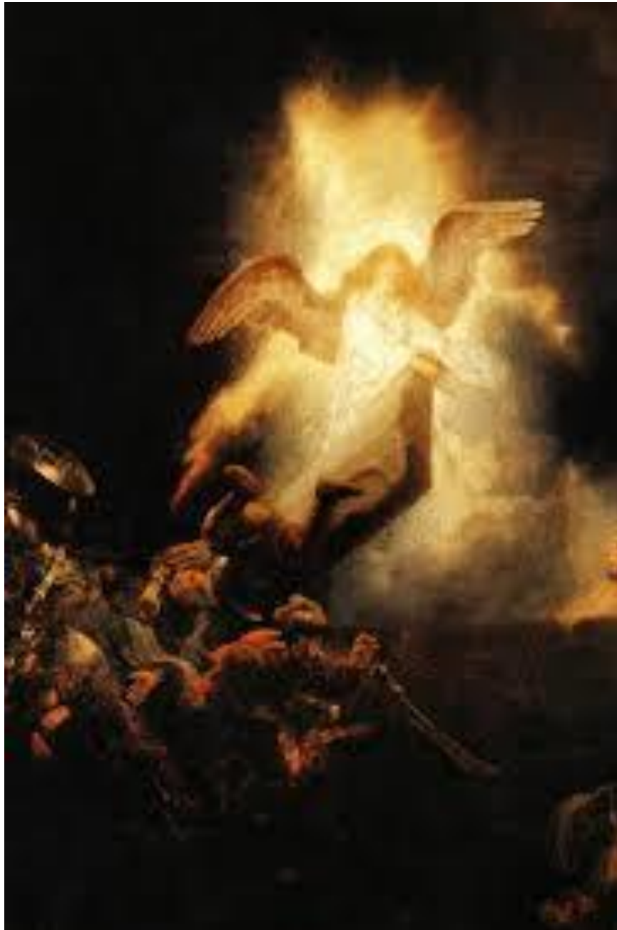
De opstanding van Christus, Rembrandt van Rijn, ca 1639 In Alte Pinakothek, München